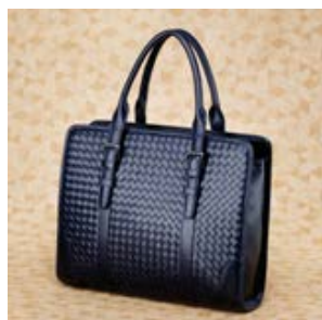
ボッテガ ヴェネタ コピー イン レ 16015