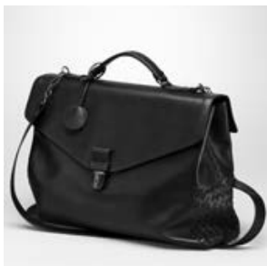
ボッテガヴェネタ (BOTTEGA VENETA) ネロ VN プリーフェース 337938V46411000