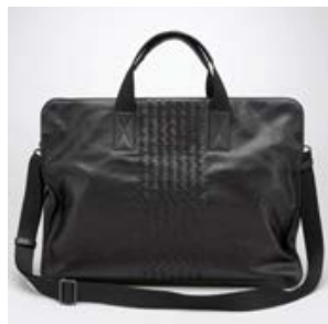
ボッテガヴェネタ (BOTTEGA VENETA) ネロ ライトカーフ イントレチャート プリーフェース