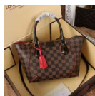
ルイ・ヴィトン ハンド&ショルダー ダミエ N41551 スリーズ カイサ・トート PM & MM N41548