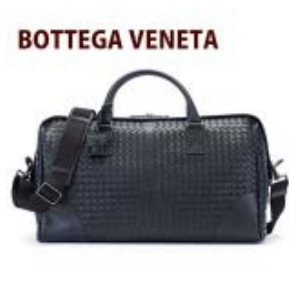
ボッテガヴェネタ (ボッテガ?ヴェネタ)BOTTEGA VENETA バッグ メンズ レディース ポストンバ