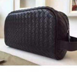
ボッテガヴェネタ BOTTEGA VENETA ネロ イントレチャート VN トイレタリーケース244706