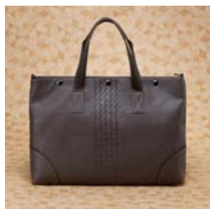
ボッテガ ヴェネタ コピー レザー ボッテガ ヴェネタ コピー ショル バッグ (2WAY仕様) ブラック 16012