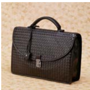
ボッテガ ヴェネタ コピー イン ス 16003-1