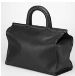
ボッテガヴェネタ (BOTTEGA VENETA) ネロ プルターニュー バッグ 323955VBG301000