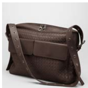
ボッテガヴェネタ (BOTTEGA VENETA) エパノ イントレチャート VN クロスボディメッセン