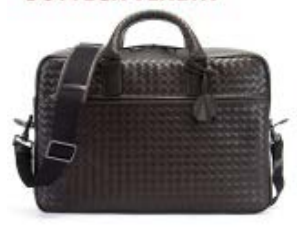
ボッテガヴェネタ BOTTEGA VENETA バッグ メンズ ショルダーバッグ プリーフェース ダ