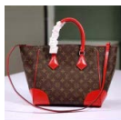
LOUIS VUITTON (ルイヴィトン) ブランドプロ フィール フェニックス PM MM M41537