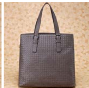
ボッテガ ヴェネタ コピー レザー トートバッグ ダークネイビー 16005-1