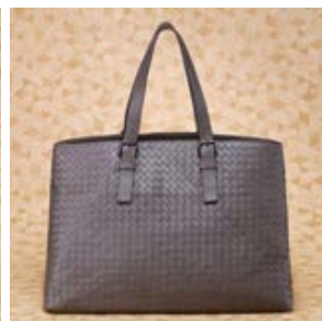
ボッテガ ヴェネタ コピー レザー トートバッグ ダークネイビー 16004