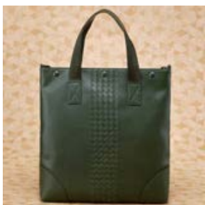
ボッテガ ヴェネタ コピー レザー バッグ (2WAY仕様) ブラック 16010