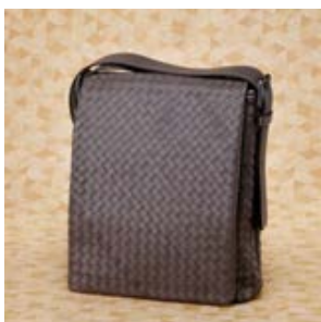
ボッテガ ヴェネタ コピー ショル ダーバッグ 16018-1