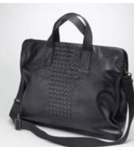
ボッテガヴェネタ (BOTTEGA VENETA) トルマリン ライトカーフ イントレチャート プリーフ