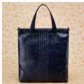
ボッテガ ヴェネタ コピー レザー バッグ (2WAY仕様) ブラック 16010-1