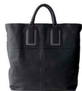
ボッテガヴェネタ (BOTTEGA VENETA) アルドアーズ パッファロー レザー メタル トート