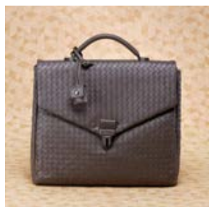
ボッテガヴェネタ コピー NTRECCIATOビジネスバッグ 16008-1