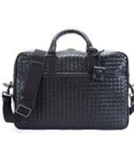
BOTTEGA VENETA ボッテガヴェネタ バッグ メンズ ビジネスバッグ プリーフェース ショルダー