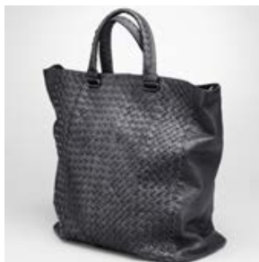
ボッテガヴェネタ (BOTTEGA VENETA) アルドアーズ イントレチャート フュメ トート