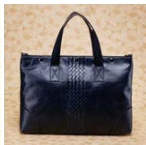
ボッテガ ヴェネタコピーレザー バッグ (2WAY仕様) ブラック 16012-1