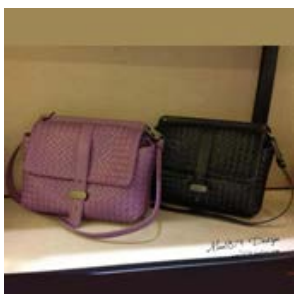
ボッテガヴェネタ (BOTTEGA VENETA) ネロ イントレチャート ナッパ バッグ