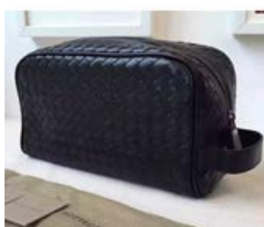
ボッテガヴェネタ BOTTEGA VENETA ネロ イントレチャート VN トイレタリーケース244706