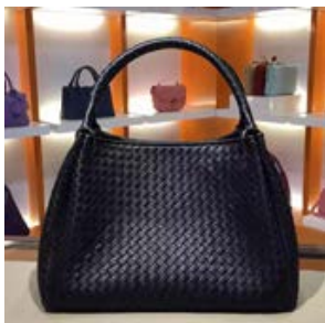
ボッテガヴェネタ BOTTEGA VENETA ネロ イントレチャート ナッパ パラシュート バッ