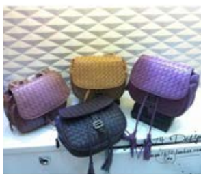
ボッテガヴェネタ (BOTTEGA VENETA) ネロ イントレチャート ナッパ メッセンジャーバッグ