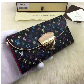
LOUIS VUITTON ルイヴィトン ポルトフォイユ・ウジェニ ミつ折 長財布 ノワールxグルナード モ ノグラム