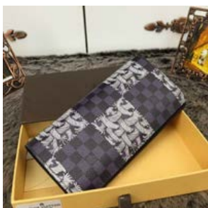
ルイヴィトン 長財布 ダミエ・グ ラフィット ポルトフォイユ・ ザ クリストファー・ネメス