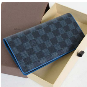
LOUIS VUITTON ルイヴィトン ポルトフォイユ・コアラ M58081 モノグラム・マルチカ フォイユ・ブラザ メンズ 長財布