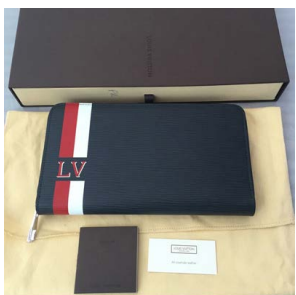
ルイヴィトン 長財布 エピ LVロゴ ザ M61590 LOUIS VUITTON