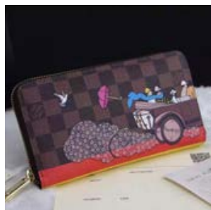
ルイヴィトン LOUIS VUITTON ダミエ ジッピー・ウォレット N61240