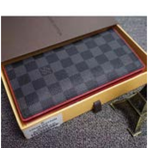
ルイヴィトン LOUIS VUITTON ダミエ・グラフィット ポルトフォ イユ・ブラザ