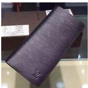
ルイヴィトン LOUIS VUITTON ポルトフォイユ・ブラザ M60622/M60615