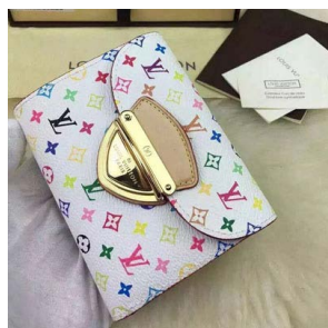
ルイ・ヴィトン モノグラム・マル チカラー ポルトフォイユ・コアラ M58081 モノグラム・マルチカ