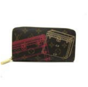
ルイヴィトン 長財布 モノグラ ム・クリスマス ポートフォリオ ジッピーウォレット M58507