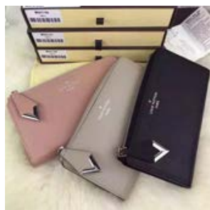
ルイヴィトン LOUIS VUITTON ポルトフォイユ・コメッ トM60146/M60148/M60147