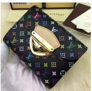
ルイ・ヴィトン ポルトフォイユコ アラ ミつ折り財布 モノグラムマ ルチカラー M58087