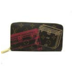
ルイヴィトン 長財布 モノグラ ム・クリスマス ポートフォリオ ジッピーウォレット M58507