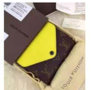
ルイ ヴィトン モノグラム×エピ ポルトフォイユマリールーコンパ クト M60427