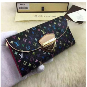
LOUIS VUITTON ルイヴィトン ポルトフォイユ・ウジェニ ミつ折 長財布 ノワール×グルナード モ