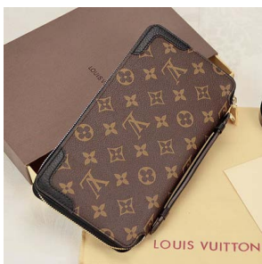
【新品】【ルイヴィトン】 財布 LOUIS VUITTON M60679 モノ グラム デイリーオーガナイザー