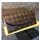
ルイヴィトン 長 財布 LOUIS VUITTON ポルト フォイユ カイ サダミエ ロー ズ バレリーヌ N61227 ¥10800円