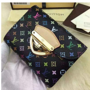
ルイ・ヴィトン ポルトフォイユコ アラ ミつ折り財布 モノグラムマ ルチカラー M58087