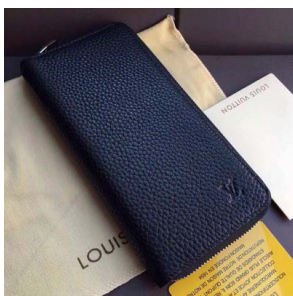
ジッピー・ウォレット ヴェルティ カル M58412 M58823