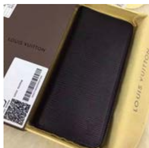
ルイヴィトン LOUIS VUITTON ジッピー・ウォレット ヴェルティ カル M60965/M60964