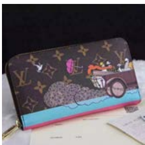
ルイヴィトン LOUIS VUITTON モノグラム ジッピー・ウォレット M61360