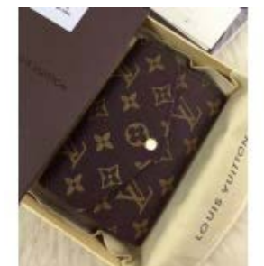
ルイヴィトン 財布 LOUIS VUITTON ヴィトン LV モノグラ ム ミディアム財布 ファスナー付