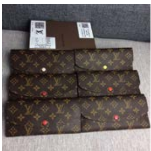
ルイヴィトン LOUIS VUITTON モノグラム ポルトフォイユ・エミ リ- M60697/M60696/M61447/1