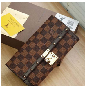
ルイヴィトン 長財布 ダミエ ポル トフォイユ・ヴェニス N60535