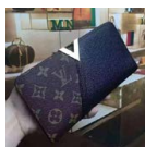
LV ルイ・ヴィ トン ポルトフォ イユ・キモノ長 財布 M56175 ノワール ¥10500円