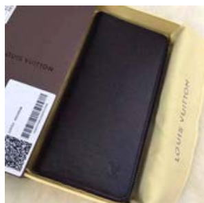
ルイヴィトン LOUIS VUITTON タイガ ジッピー・ウォレット ヴェルティカル