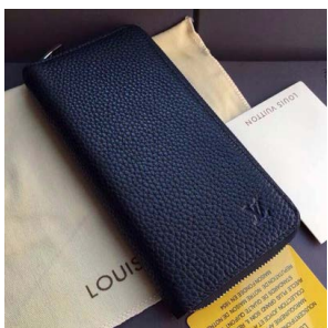
ジッピー・ウォレット ヴェルティルイ カル M58412 M58823