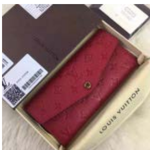
LOUIS VUITTON Curieuse Wallet M60341 M60565 M60732 ポルトフォイユ・キュリ ム