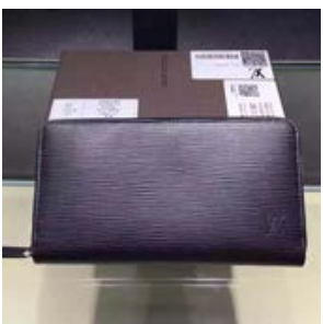
ルイヴィトン LOUIS VUITTON ジッピー・オーガナイザー M60632