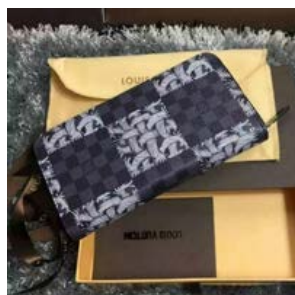
ルイヴィトン 長財布 ダミエグラ フィット ジッピー・オーガナイ ザー クリストファー・ネメス