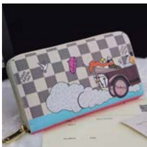
ルイヴィトン LOUIS VUITTON ダミエ・アズール ジッピー・ウォ レット N61241