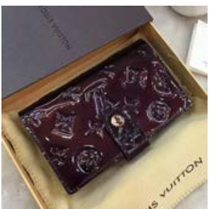
ルイヴィトン LOUIS VUITTON ポルトフォイユ・ヴィエノ ワ M93521/M91768