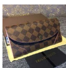
ルイヴィトン 長 財布 LOUIS VUITTON ポルト フォイユ カイ サダミエ ロー ズ バレリーヌ N61227 ¥10800円