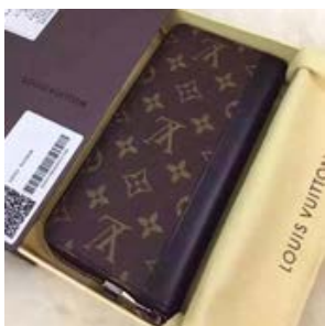
ルイヴィトン LOUIS VUITTON モノグラム ジッピー・ウォレット ヴェルティカル M60109