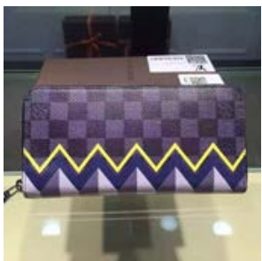
ルイヴィトン LOUIS VUITTON ダミエ・グラフィット ジッピー ウォレット・ヴェルティカル