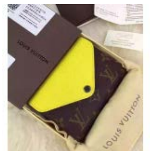
ルイ ヴィトン モノグラムxエピ ポルトフォイユマリールーコンパ クト M60427