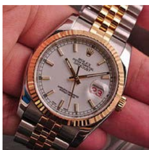
ロレックス スーパーコピー オイスターペチュアル デイト 116233