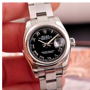
ロレックス スーパーコピー オイスターペチュアル デイト 179160-5