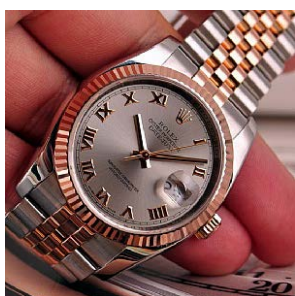
ロレックス スーパーコピー オイスターペチュアル デイト 116231-1