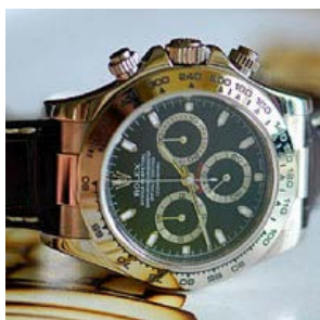
ロレックス スーパーコピー オイスターペチュアル デイトナ 116519-2