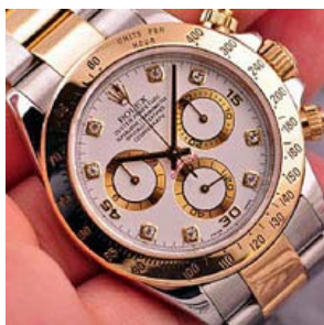
ロレックス スーパーコピー オイスターペチュアル デイトナ 116523G-2