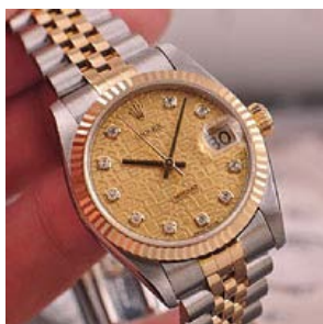
ロレックス スーパーコピー オイスターペチュアル デイト 178273G