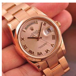
ロレックス スーパーコピー オイスターペチュアル デイト 118205F-2