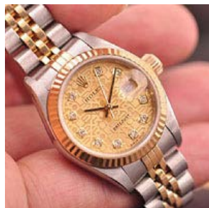
ロレックス スーパーコピー オイスターパーペチュアル ト 179173G-2