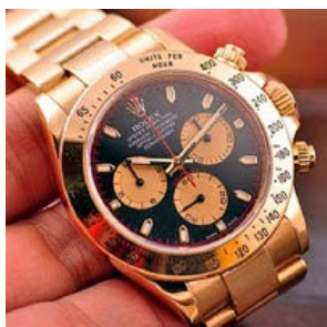
ロレックス スーパーコピー オイスターペチュアル デイトナ 116528-5