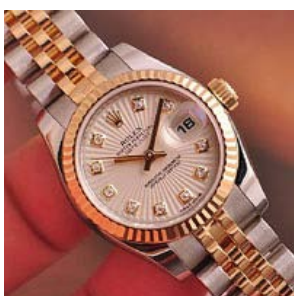
ロレックス スーパーコピー オイスターペチュアル デイト 179173Ge