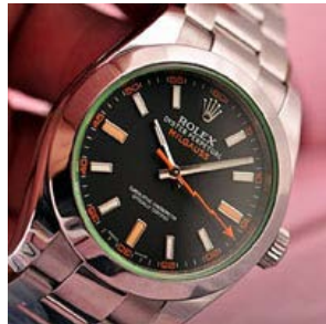
ロレックス スーパーコピー オイスターパーペチュアル 116400GV