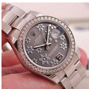
ロレックス スーパーコピー オイスターペチュアル デイト 178384-2