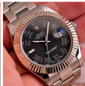
ロレックス スーパーコピー オイスターパーペチュアル ト I I 116334-3