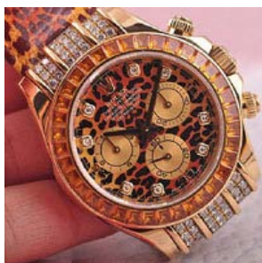
ロレックス スーパーコピー オイスターペチュアル デイトナ レパード 116598SACO