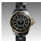
シャネル J12 スーパーコピー クロノ スーパー コピー 33 H2543 ¥28000円