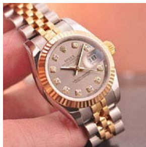
ロレックス スーパーコピー オイスターパーペチュアル ト 179173G-3