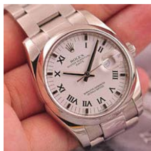
ロレックス スーパーコピー オイスターペチュアル デイト 115200-7