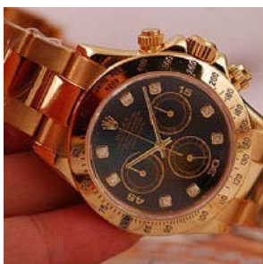
ロレックス スーパーコピー オイスターペチュアル デイトナ 116528G-1