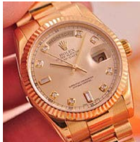
ロレックス スーパーコピー オイスターパーペチュアル 118238A