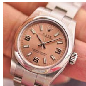
ロレックス スーパーコピー オイスターパーペチュアル ト 116233-1