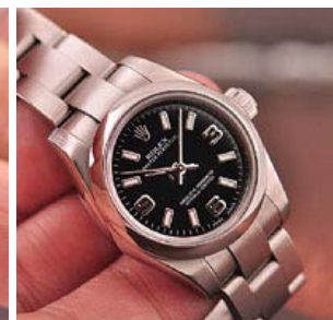
ロレックス スーパーコピー オイスターパーペチュアル 176200-7