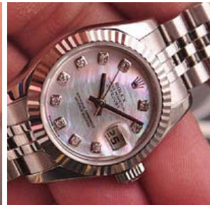
ロレックス スーパーコピー オイスターパーペチュアル ト 179174NG-2