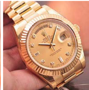
ロレックス スーパーコピー オイスターパーペチュアル I I 218238A