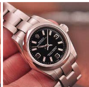
ロレックス スーパーコピー オイスターパーペチュアル ト 176200-7