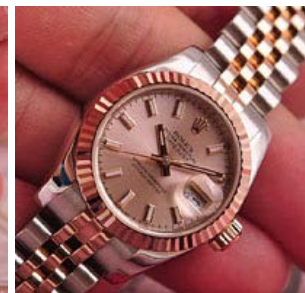
ロレックス スーパーコピー オイスターパーペチュアル ト 179171-2