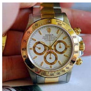
ロレックス スーパーコピー オイスターペチュアル デイトナ 116523-4