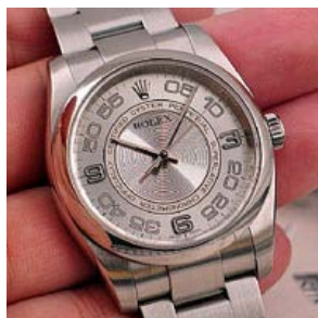
ロレックス スーパーコピー オイスターパーペチュアル ト 116200-4