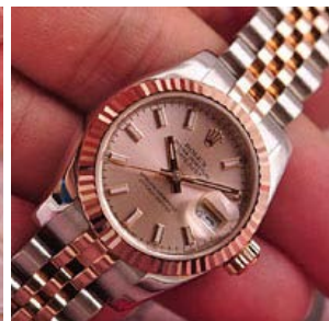
ロレックス スーパーコピー オイスターパーペチュアル ト 179171-2