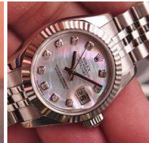
ロレックス スーパーコピー オイスターパーペチュアル ト 179174NG-2