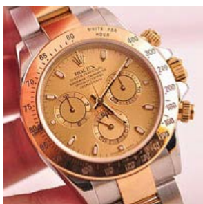
ロレックス スーパーコピー オイスターペチュアル デイトナ 116523NG-1