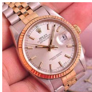
ロレックス スーパーコピー オイスターパーペチュアル ト 116200-3