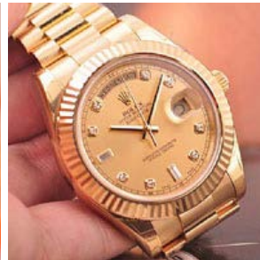
ロレックス スーパーコピー オイスターパーペチュアル I I 218238A